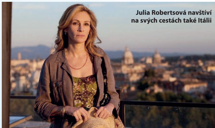
Julia Robertsová navštíví na svých cestách také Itálii